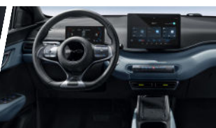
Sistema de Cabina Inteligente BYD