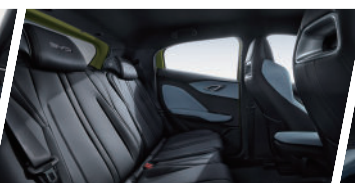
Espacio Interior Optimizado